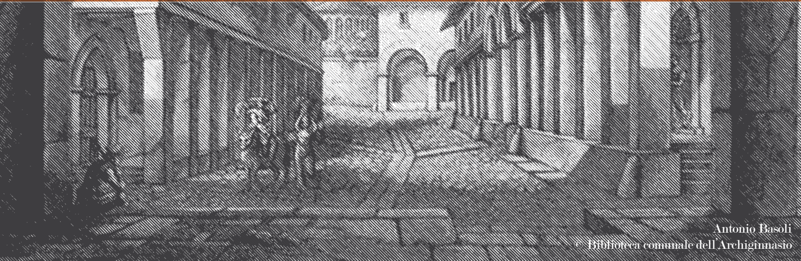
Antonio Basoli

Per informazioni / Information: Dipartimento Economia e Promozione della Città Comune di Bologna tel. ++39 051 2195951 candidatureporticiunesco@comune.bologna.it